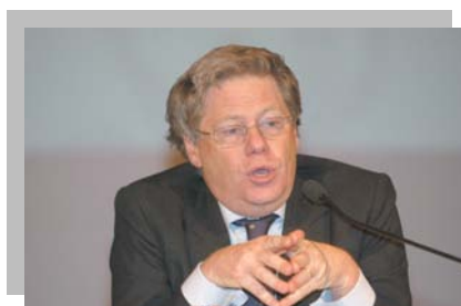
Dr. Dell'Alba Gianfranco - Capo Gabinetto Ministro Politiche Europee

Tre passaggi vitali per la nostra categoria, che rappresenterebbero il coronamento del lavoro e delle fatiche profuse in tutti questi anni, quasi dieci, per la gran parte trascorsi a sensibilizzare l'opinione pubblica e le istituzioni riguardo al rilievo sociale ed economico delle nostre attività. Abbiamo sempre espresso con determinazione, il nostro impegno alla mediazione e il nostro rispetto per il ruolo del settore pubblico oltre che per quello degli ordini professionali e delle associazioni di impresa che erogano servizi amministrativi. non abbiamo mai invocato posizioni di privilegio,